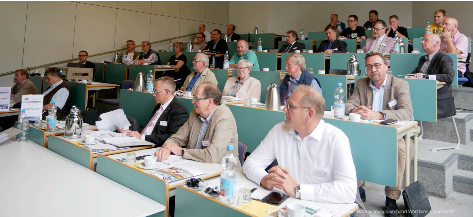
Der Blick in den gut gefüllten Hörsaal der Ersten Deutschen Bäckerfachschule.